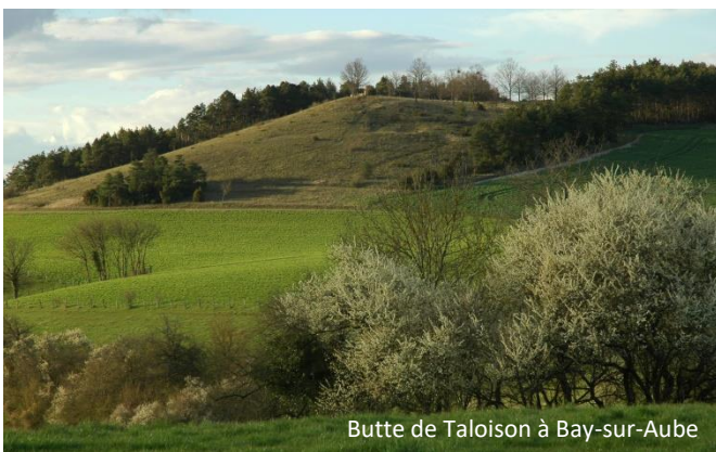
Butte de Taloisson à Bay-sur-Aube

Le site Natura 2000 des « Pelouses submontagnardes du plateau de Langres » comprend, à l'origine, 3 secteurs distincts localisés aux environs d'Auberive : la « Butte de Taloisson » sur la commune de Bay-sur-Aube, la « Butte du Haut-du-Sec » sur la commune de Perrogney-les-Fontaines et la « Butte des Teurets » sur la commune de Poinsonot. 2 autres secteurs ont été intégrés en 2016 sur les communes d'Arbot et de Poinson-les-Grancey. Ce site s'étend sur 30 hectares et est principalement constitué de pelouses de type submontagnard sur buttes de calcaire oolithique.